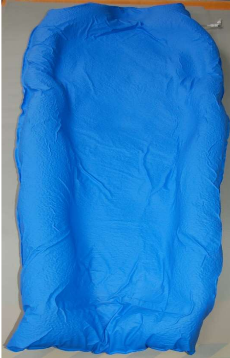
Vacuümkussens 80 x 60 cm

Het principe van een vacuümkussen zit in het fixeren van de vulling door alle lucht ertussen weg te zuigen. Door het kussen naar het lichaam en de houding van de patiënt te vormen en dan vacuüm te trekken, ontstaat een zeer stevige ondersteuning voor de patiënt.